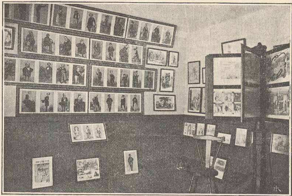
MUSEU RAFAEL BORDALO PINHEIRO