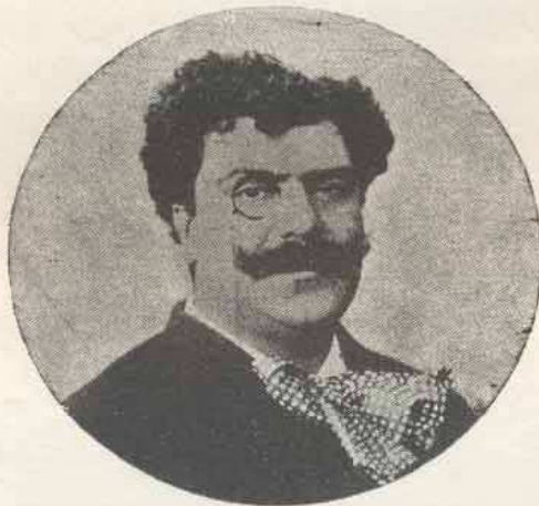
RAFAEL BORDALO PINHEIRO EM 1880.