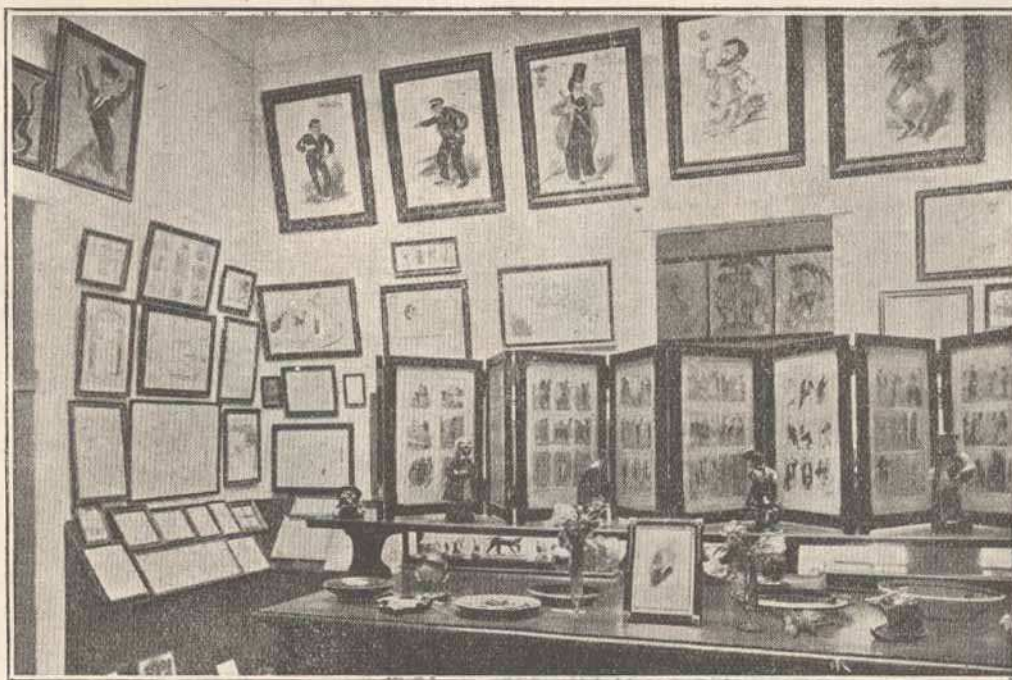
MUSEU RAFAEL BORDALO PINHEIRO