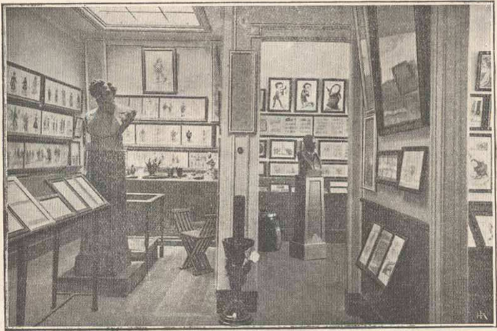
MUSEU RAFAEL BORDALO PINHEIRO