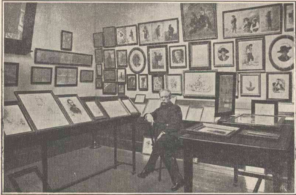
MUSEU RAFAEL BORDALO PINHEIRO