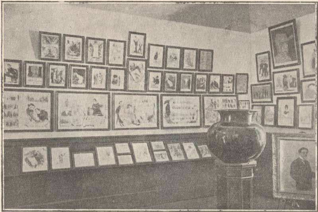
MUSEU RAFAEL BORDALO PINHEIRO