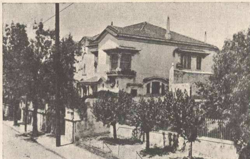
EDIFICIO ONDE ESTÁ INSTALADO O MUSEU RAFAEL BORDALO PINHEIRO